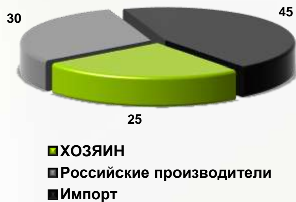
Структура рынка кормораздатчиков в Российской Федерации, %